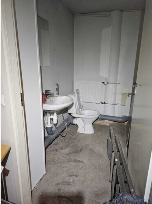
Kuva 1 Myymälän wc.