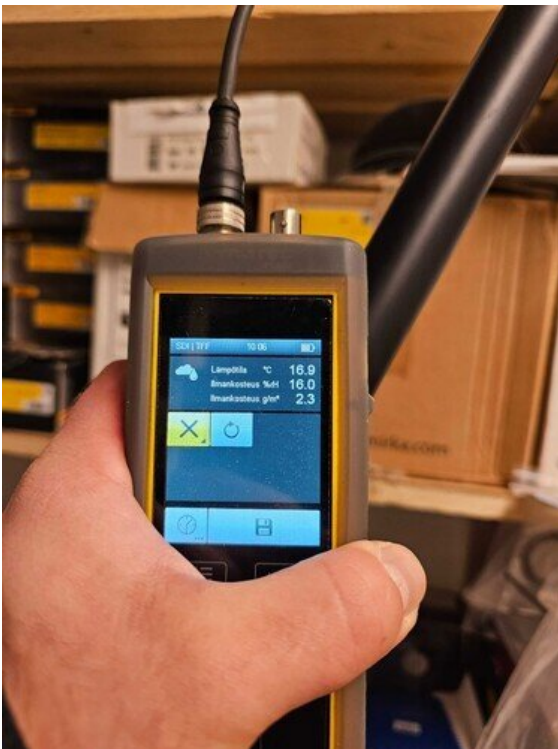
Kuva 2 Sisäkaton kosteusmittaus