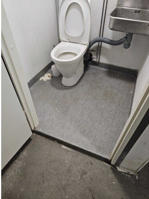
Kuva 3 Patokynnykset puuttuu.