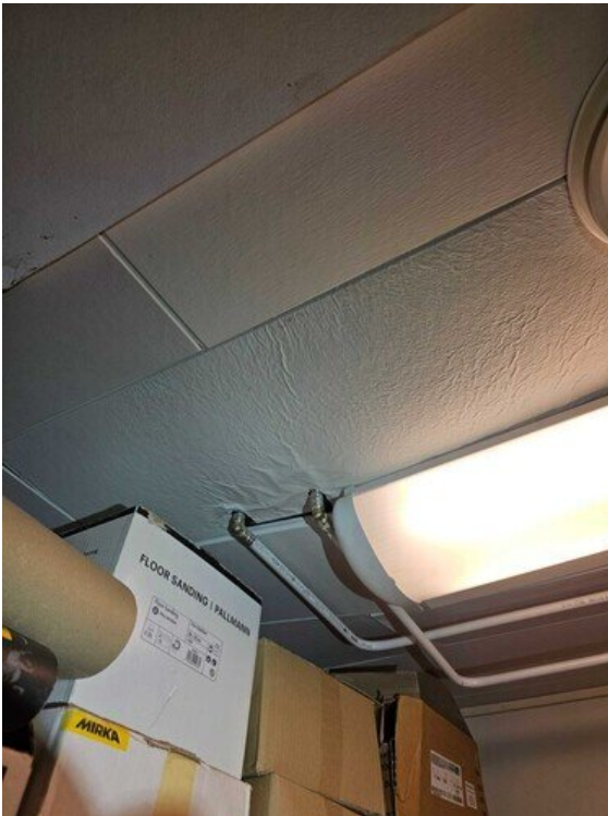
Kuva 1 Sisäkatossa vesiputkien kohdalla kosteusjäljet. Kts. pohjakuvan 1, Liiketilän 9b pohjapiirros_2026012314080403840000007727 merkintä 1.