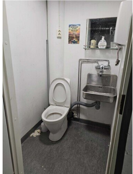
Kuva 2 Varastotilan wc.