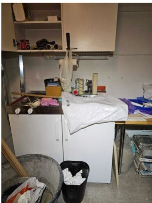
Kuva 5 Minikeittiö.