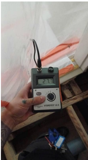
Kantava hirsi kesäkuun lopussa