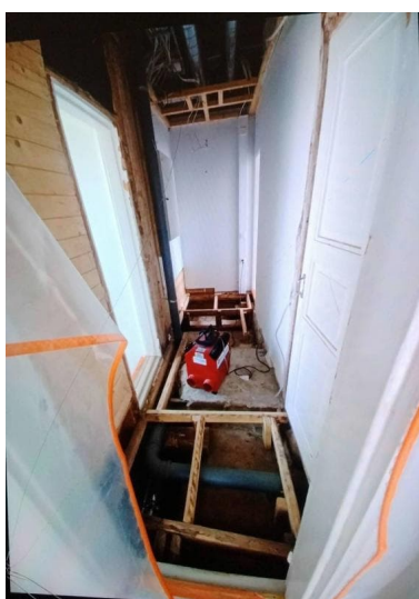
Ctr K3 kondensiokuivain