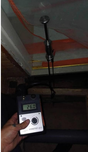
Kantava hirsi heinäkuun puolivälissä