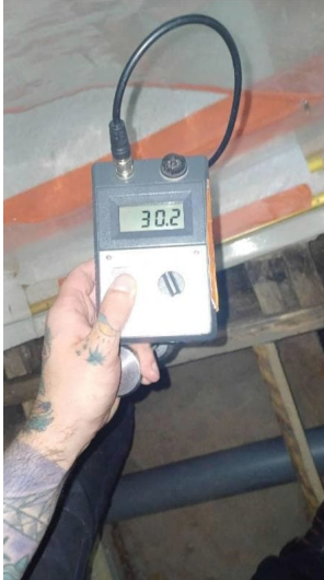
Kantava hirsi kesäkuu