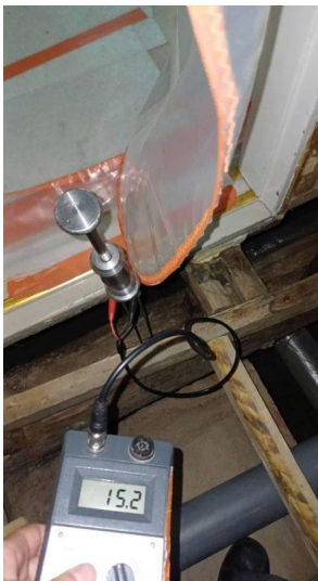
Hirsi kuiva elokuussa