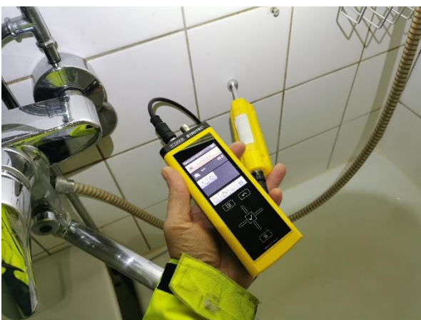
Kuva 3. Suihkuseinästä mitattuna 48.9 (kuiva).