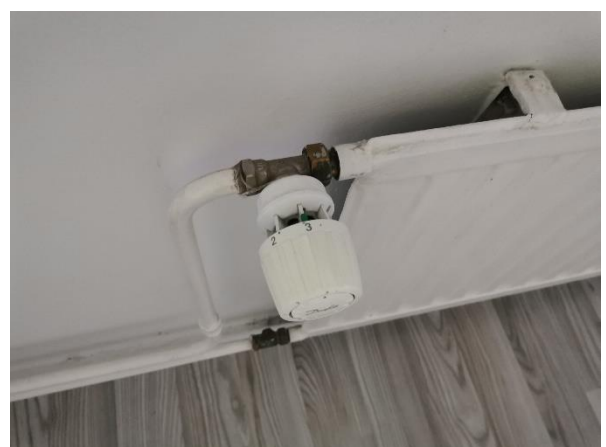
Kuva 19. Lämmityspattereiden termostaatti-venttiilit on uusittu.