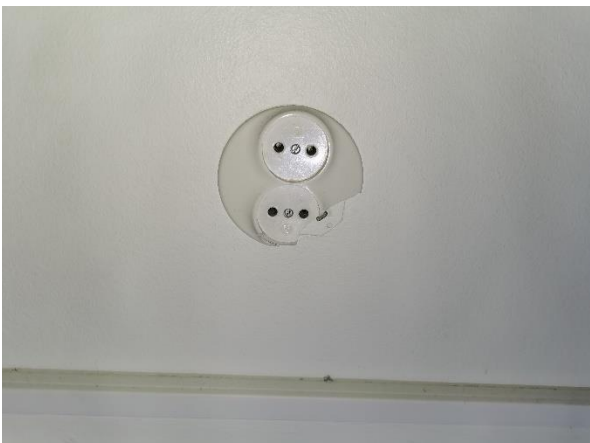
Kuva 16. Olohuoneen pistorasian kehys rikki.