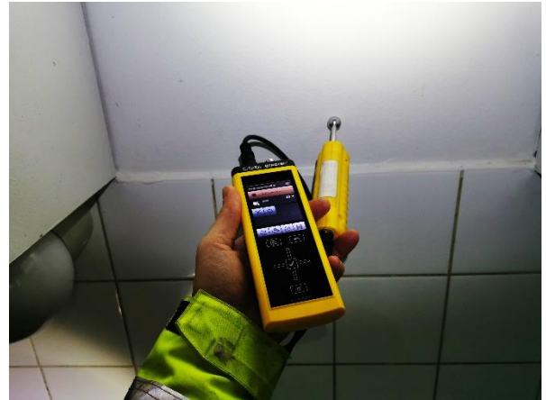
Kuva 9. Betoniseinästä mitattu 59.4 (kuiva).