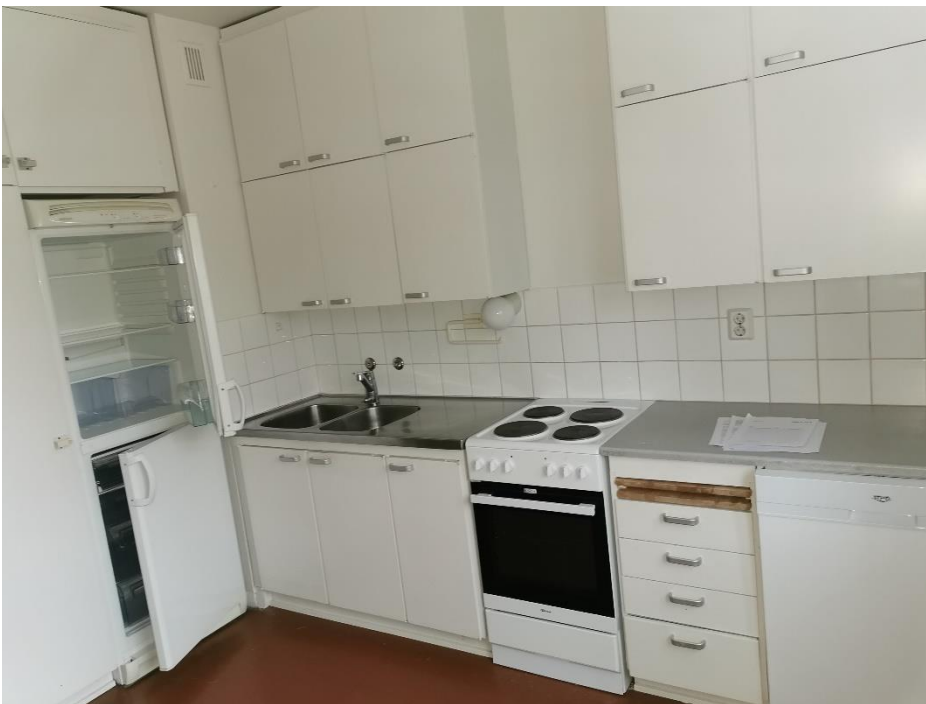
Kuva 7. Kylpyhuoneen käyttövesiputket on uusittu putkisanerauksen yhteydessä.