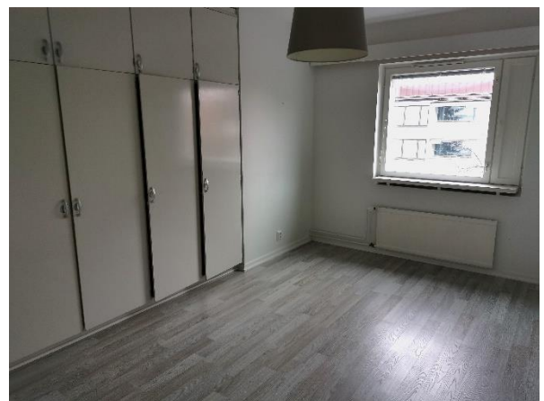
Kuva 13. Iso makuuhuone.