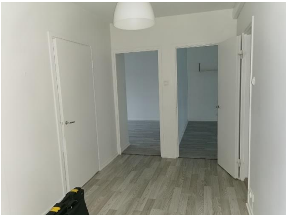
Kuva 10. Eteisen yleiskuva.