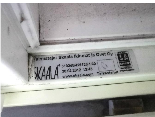
Kuva 18. Ikkunat ja parvekeovet on uusittu.