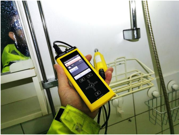
Kuva 5. Suihkuseinästä mitattuna 50.4 (kuiva).