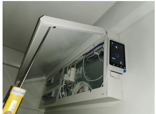
Kuva 11. Eteisessä uusittu sähkökeskus.