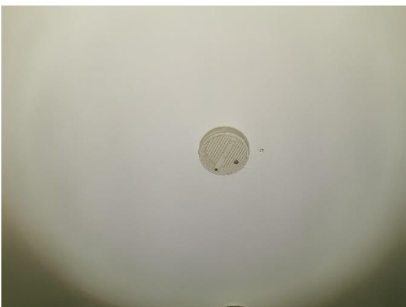
Kuva 12. Eteisen palovaroitin.