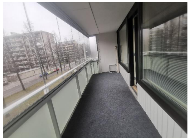
Kuva 17. Ikkunat ja parvekeovet on uusittu.