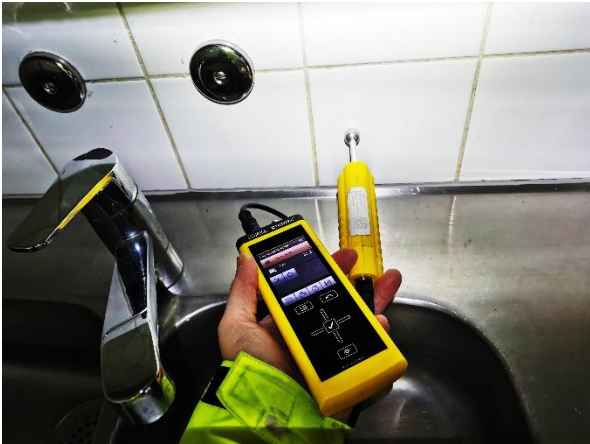
Kuva 8. Taustalaatoista mitattuna 53.3 (kuiva).