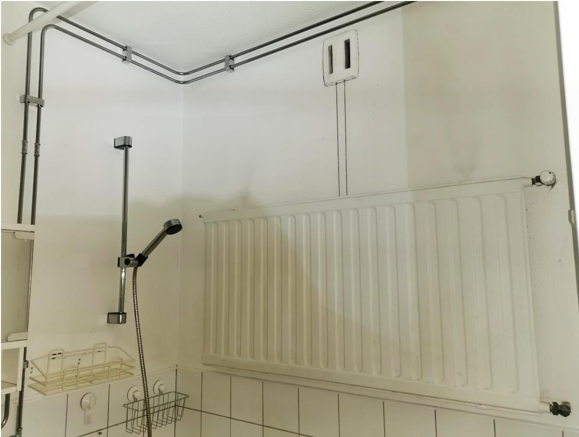
Kuva 2. Kylpyhuoneen käyttövesiputket on uusittu putkisanerauksen yhteydessä.