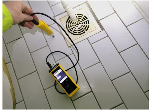
Kuva 6. Lattiasta mitattuna 56.5 (kuiva).