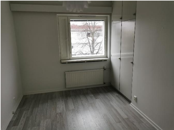
Kuva 14. Pienempi makuuhuone.