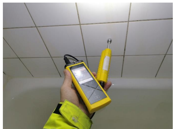
Kuva 4. Sivuseinästä mitattuna 57.3 (kuiva).