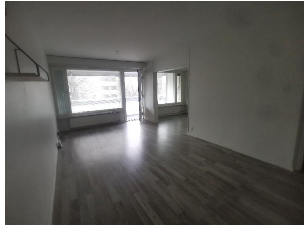
Kuva 15. Olohuone.