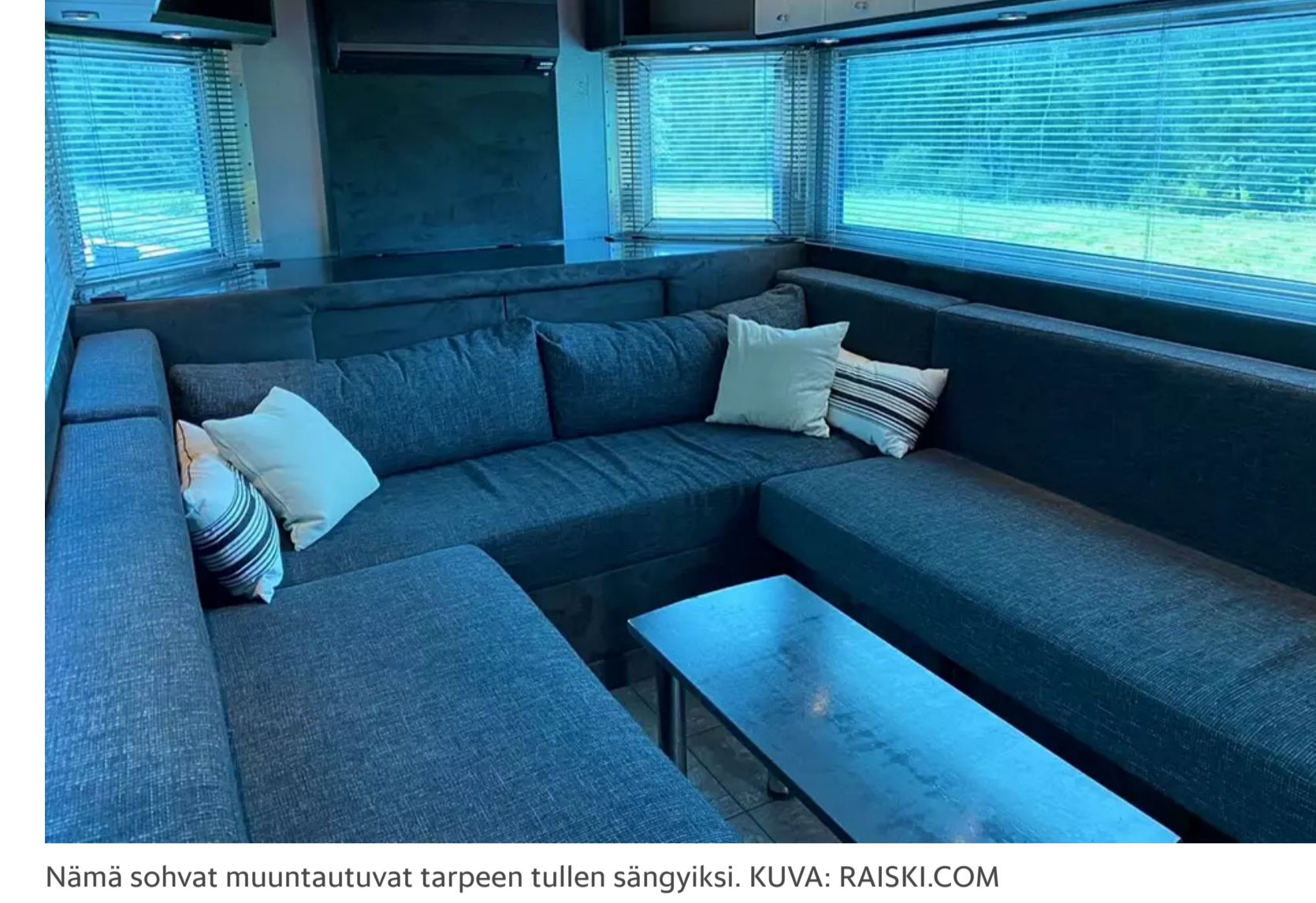
Nämä sohvat muuntautuvat tarpeen tullen sängyiksi.

Kuumuudessa taivaltavaa ravhastaa voi katsella katolla olevalta terassilta. Hintaa Espoossa olevalla trailerilla on riiptä parisensataa tuhatta euroa.