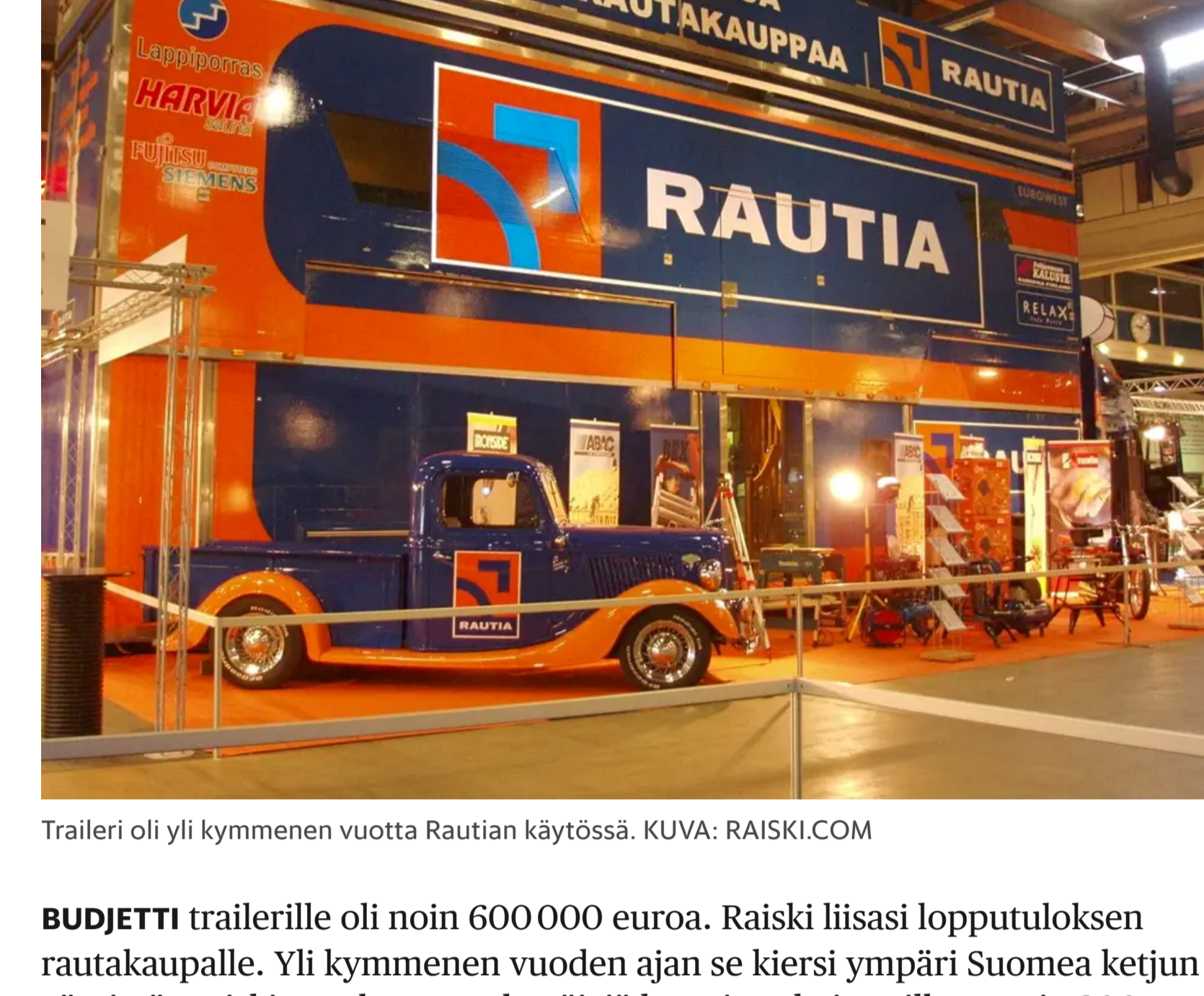
Traileri oli yli kymmenen vuotta Rautian käytössä.

”Sanoivat, että idea on niin pöljä, että tähän on pakko lähteä mukaan.”