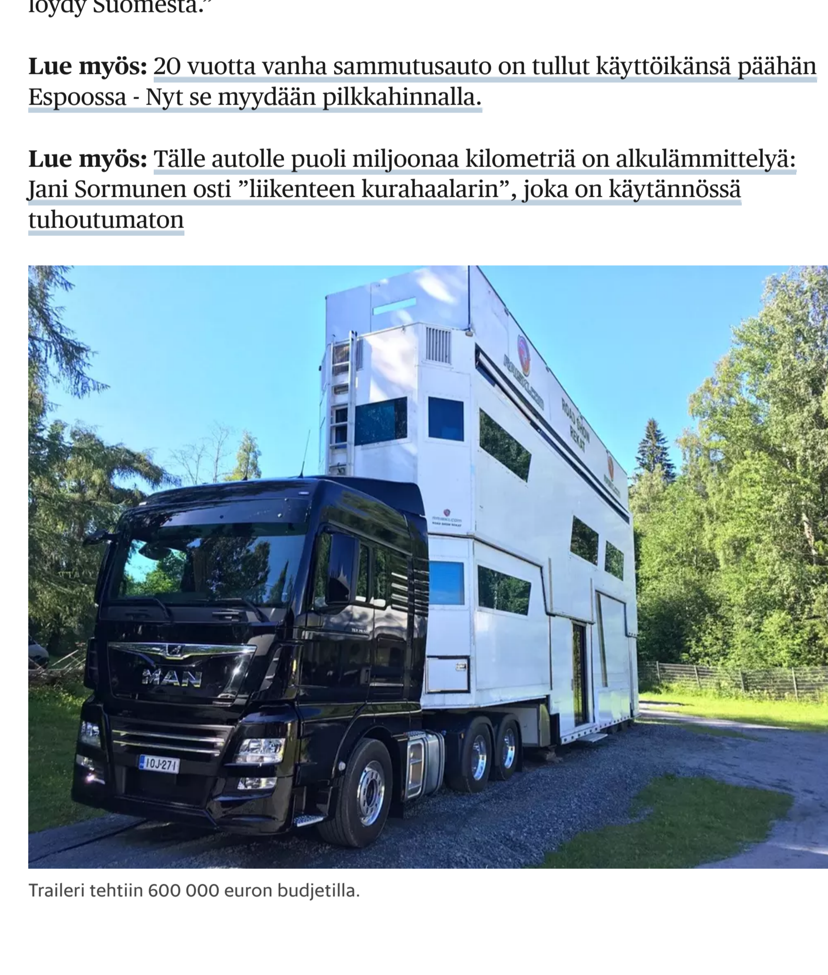
Traileri tehtiin 600 000 euron budjetilla.

Lue myös: Tälle autolle puoli miljoonaa kilometriä on alkulämmittelyä: Jani Sormunen osti ”liikenteen kurahaalarin”, joka on käytännössä tuhoutumaton